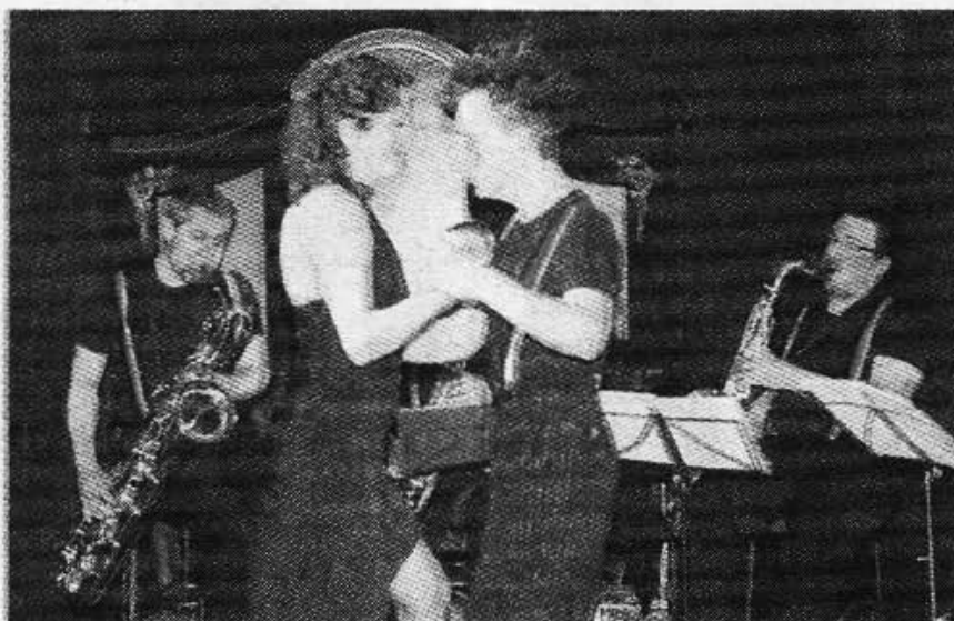
■ L'orchestre et les danseurs ont laissé transpirer l'âme de Buenos Aires.

Pour la clôture de ce 7 e festival jeune public de l'ouest roannais (plus de 1 600 spectateurs accueillis au total), la scène a été livrée à la compagnie Choc Trio, son clown et ses musiciens. Un univers en rouge et noir pour «Guitare Amoroso» une fantaisie très chaloupée mettant en scène le personnage central face à sa réalité d'objets et à sa quête d'amour. Celui de sa guitare classique sexy ou celui de sa consoeur électrisée. Le clown est à la fois fort habile et fort maladroit dans ses comportements, il oscille entre jongleries manuelles et sentimentales, laissant aux spectateurs le soin de s'y retrouver dans sa quête de l'inaccessible. Tout cela sur l'âme des tangos joués par le petit orchestre de saxs et bandonéons en fond de scène. Une âme dansée après le spectacle dans un petit bal façon Argentine. Guitare Amoroso, tout nouveau spectacle de la compagnie Choc Trio, mérite sans doute quelques réglages dans le rythme pour en donner une lecture plus fluide et évidente, tant il y a de la richesse dans son propos. Le festival «Eclats» pointe déjà le bout de