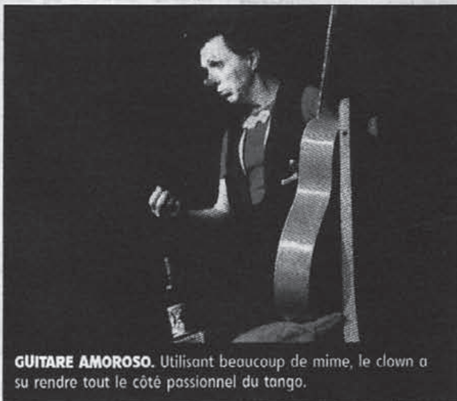
GUITARE AMOROSO. Utilisant beaucoup de mime, le clown a su rendre tout le côté passionnel du tango.

Ce spectacle burlesque et musical qui choisit le tango, sa musique, sa danse, ses instruments, ses personnages pour décrire les rapports amoureux, a su