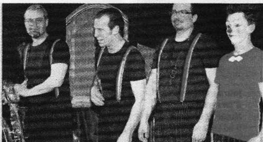
■ Trois musiciens et un clown pour un spectacle qui donne à voir et à entendre.

son nez du 18 au 23 mars à Saint-Jean-Saint-Maurice et