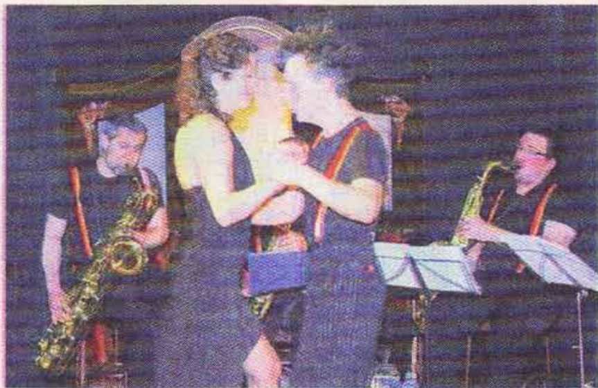
■ L'orchestre et les danseurs ont laissé transpirer l'âme de Buenos Aires.

Pour la clôture de ce 7 e festival jeune public de l'ouest roannais (plus de 1 600 spectateurs accueillis au total), la scène a été livrée à la compagnie Choc Trio, son clown et ses musiciens. Un univers en rouge et noir pour «Guitare Amoroso» une fantaisie très chaloupée mettant en scène le personnage central face à sa réalité d'objets et à sa quête d'amour. Celui de sa guitare classique sexy ou celui de sa consoeur électrisée. Le clown est à la fois fort habile et fort maladroit dans ses comportements, il oscille entre jongleries manuelles et sentimentales, laissant aux spectateurs le soin de s'y retrouver dans sa quête de l'inaccessible. Tout cela sur l'âme des tangos joués par le petit orchestre de saxs et bandonéons en fond de scène. Une âme dansée après le spectacle dans un petit bal façon Argentine. Guitare Amoroso, tout nouveau spectacle de la compagnie Choc Trio, mérite sans doute quelques réglages dans le rythme pour en donner une lecture plus fluide et évidente, tant il y a de la richesse dans son propos. Le festival «Eclats» pointe déjà le bout de