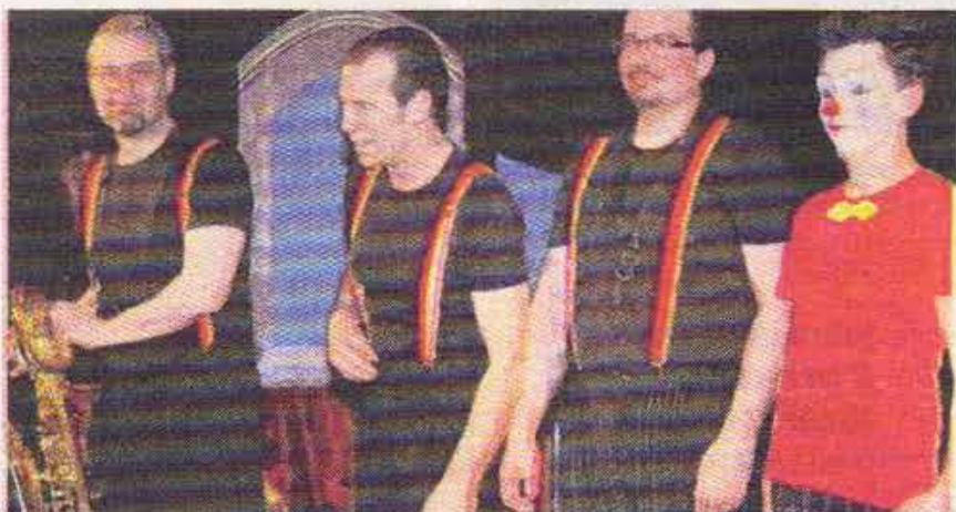
■ Trois musiciens et un clown pour un spectacle qui donne à voir et à entendre.

son nez du 18 au 23 mars à Saint-Jean-Saint-Maurice et