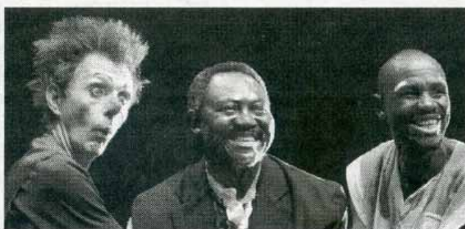
Les artistes de Quai Nord-sud.

La Compagnie sera au moulin du marais pour préparer son nouveau spectacle. Né de la rencontre et de l'amitié entre artistes français et Camerounais, « Quai Nord-Sud »