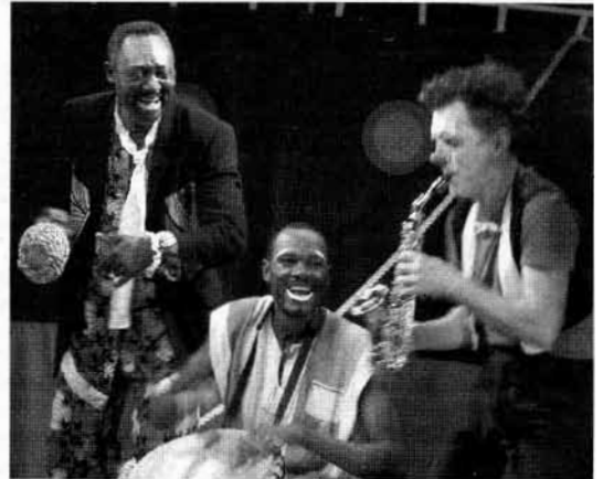
Les clowns du spectacle « Quai nord sud ».

créée à Lusignan, dans le département de la Vienne, en 1996. Devenue compagnie professionnelle, elle diffuse ses spectacles dans toute la France et dans le monde avec pour objectif de favoriser l'échange entre les artistes de deux pays et aider à leur circulation, de confronter les pratiques, les cultures, d'opposer un front artistique à l'incompréhension entre les peuples, au racisme et à la violence, d'amener cette collaboration franco-camerounaise au plus près des populations rurales ou enclavées, tout en permettant au public de découvrir une facette originale de l'art clownesque.